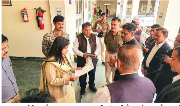
मामला दर्ज किया है।