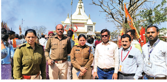
हरिभूमि न्यूज़ | नर्मदापुरम

सतपुड़ा की रानी के नाम से विख्यात पचमढ़ी एक बार फिर आस्था के महासंगम का साक्षी बनने जा रही है। महाशिवरात्रि मेला 2026 की सभी तैयारियां पूर्ण कर ली गई हैं। कैंटोनमेंट बोर्ड पचमढ़ी ने इस वर्ष लाखों श्रद्धालुओं की सुविधा, सुरक्षा और स्वच्छता को सर्वोच्च प्राथमिकता देते हुए व्यापक एवं सुव्यवस्थित इंतजाम किए हैं। महादेव के दर्शन के लिए देशभर से आने वाले भक्तों को किसी प्रकार की असुविधा न हो, इसके लिए बुनियादी ढांचे में उल्लेखनीय सुधार किए गए हैं।