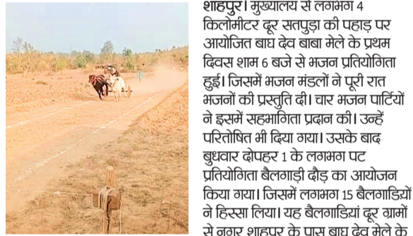
पांचों में आयोजित बैलगाड़ी दौड़ प्रतियोगिता में हिस्सा लेने के लिए पहुंची आज गुरुवार को मेला का समापन होगा। कल दिन भर बैलगाड़ी दौड़ प्रतियोगिता प्रारंभ रहेगी। शाम को परितोषित वितरण किया जाएगा।