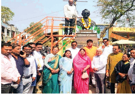
हरिभूमि न्यूज़ ▶▶ गुलताई