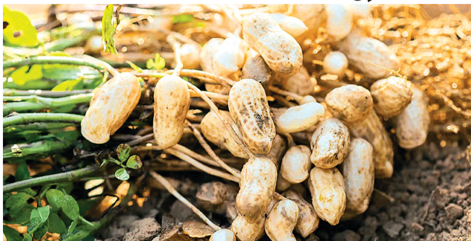
हरिभूमि न्यूज़ ▶▶ बैतूल

गर्मी के मौसम में किसानों को तीसरी फसल के लिए कृषि विभाग ने इस बार मूंग की जगह मूंगफली उत्पादन को बढ़ावा देने की तैयारी की है। नेशनल मिशन ऑन ऑयल सीड्स के तहत जिले के पांच विकासखंडों में 300 हेक्टेयर क्षेत्र में ग्रीष्मकालीन मूंगफली उत्पादन का लक्ष्य तय किया है।